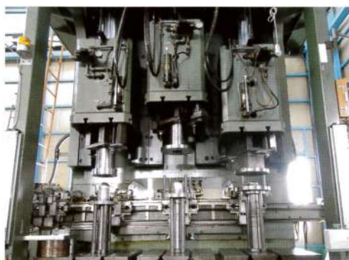
多行程油圧プレス